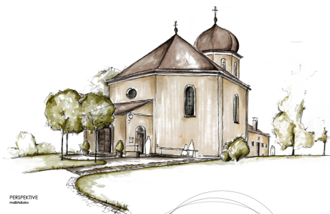
PERSPektIVE mit Maßstab