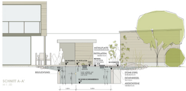
SCHNITT A-A' M 1 : 30